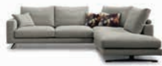
New York 12-23